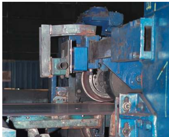
Berührungslose Geschwindigkeitsmessung mit dem VLM 200

Hierbei geschieht es immer wieder, daß ein Teil dieser Bänder beim Wickelvorgang verläuft. Zusätzlich entstehen während des Walzvorganges in der Walzstraße an einigen Bändern Toleranzverletzungen der geometrischen