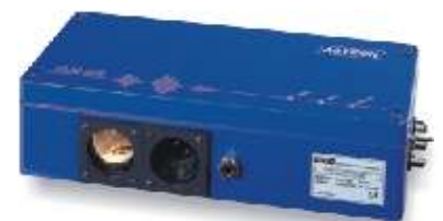
Berührungsloses Geschwindigkeitsmeßsystem VLM 200